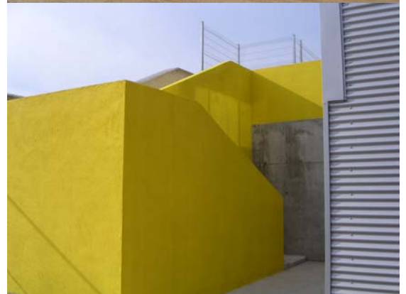
Fotos de l'obra